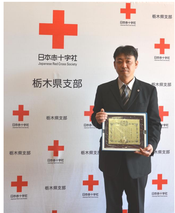
受領した金色有功章と協立製作所代表

これからも株式会社協立製作所は、弊社の理念にもとづき、事業とCSR活動を一体化して進めていきます。より多くの方々に役立つように、企業の社会的責任を果たし、配電盤・制御盤の設計・製造を通し、国家・社会に貢献できる企業を目指します。