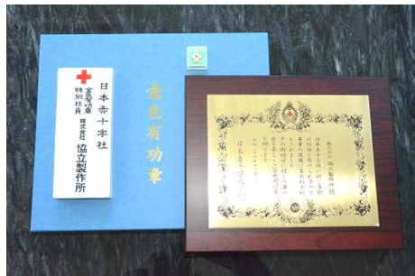
受領した金色有功章 (楯・表札・徽章)