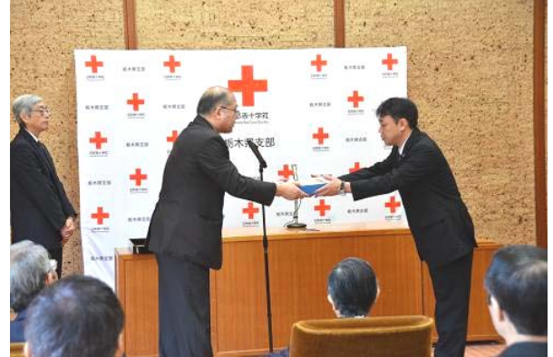
日本赤十字社栃木県副支部長より金色有功章を受章する協立製作所代表