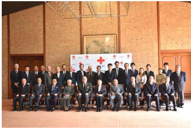
受章者の記念撮影