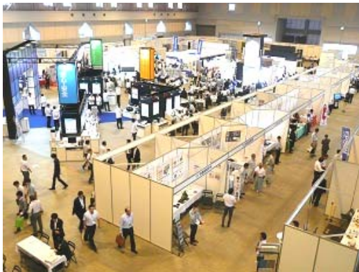
出展ブースの全景