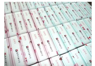
弊社来客者様への記念品 (懐中 LED ライト)

制御盤・配電盤のメーカーとして、ネジのゆるみ等を原因とした異常昇温による配電盤等の焼損事故を撲滅することが社会的責任であると認識し、わたしたちは『盤ドック』メンテナンスを営業しております。これからも、(株)協立製作所は、配電盤・制御盤の設計・製造を通し、国家・社会に貢献できる企業を目指します。